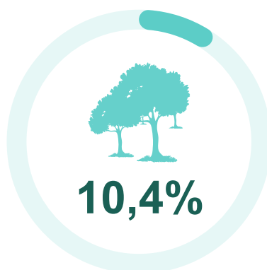
Outras espécies florestais